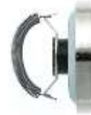
JOUSIKIINNITYS RX101 JA RX115